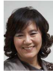
Music director and conductor of the Daejeon Civic Youth Choir