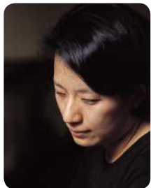
피아니스트 _ 임성애 (Pianist _ Seong-Ae Lim)