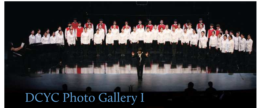
DCYC Photo Gallery I